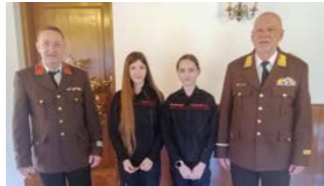
GUT HEIL FF-KEMETBERG